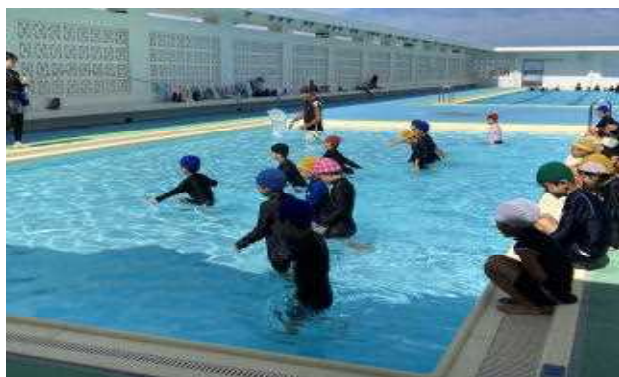
↑2年生の水泳授業の様子