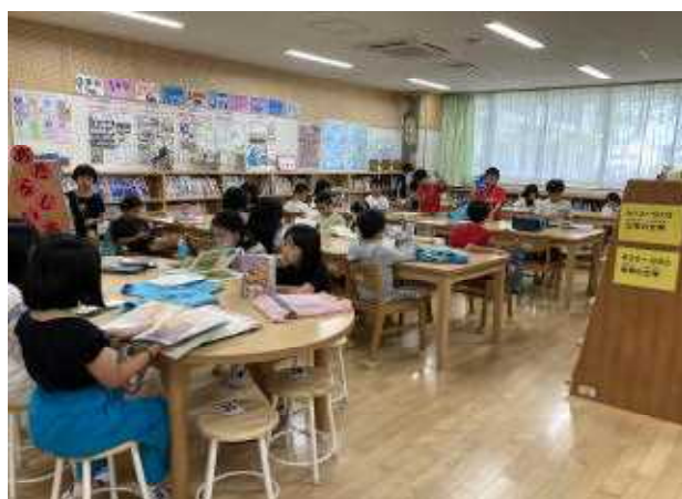
↑図書室では静かに本を読んでいます。ご家庭でも時間を決めて読書をして、本に親しんでほしいです。