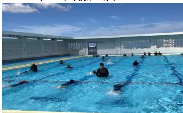
↑4年生は水泳指導員の指導を受けて頑張ってます