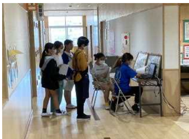
↑今朝は図書委員会による「読書月間」の取組紹介の放送がありました。