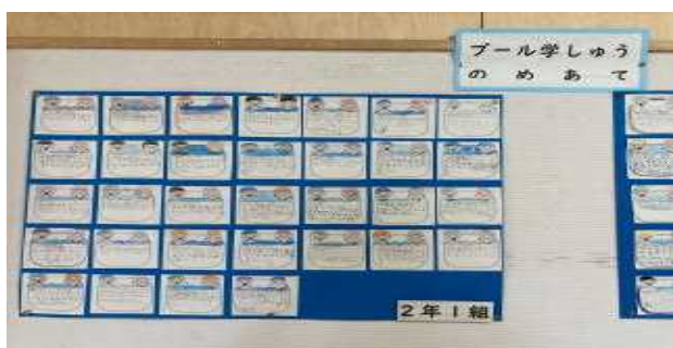
↑水泳学習の個人のめあて(目標)