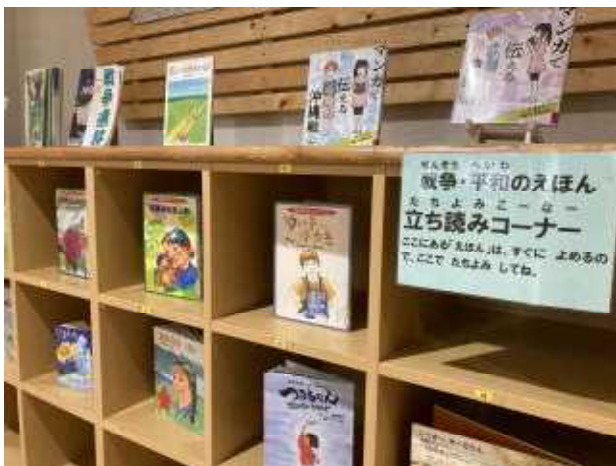
↑ 図書室前の企画展

☆図書委員さんの提案で、コロナ禍で利用禁止の時間（昼休み・放課後）が無くなり、図書館利用できる時間が増えました。図書委員手作りのお知らせポスターです。図書委員の皆さん、ステキなアイデアありがとう！