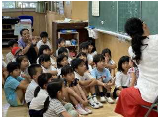
↑ 読み聞かせを聞く1年生

☆図書室内や図書室前の廊下では、その時期に合わせたテーマの様々な本を紹介しています。今月は平和月間に合わせて「戦争・平和の絵本」の立ち読みコーナーを設置しています。ぜひ読んでほしいです。