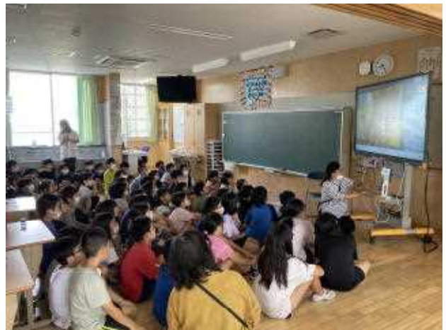
↑ 読み聞かせを聞く4年生

☆毎週木曜の読み聞かせは、子ども達の楽しみにしている「読み聞かせ」の時間です。自分で本を読む楽しさ、読んでもらう楽しさ、どちらも楽しんでほしいです。