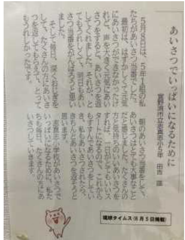
↑新聞掲載第1号の記事

☆図書室前には「NIEコーナー」(NIE=新聞を教育に!)を設置しています。児童の日記や作文を新聞社に投稿して、掲載されるといいなと思っているところです。さっそく、掲載第一号(5年児童)がでましたので、写真でご紹介します。