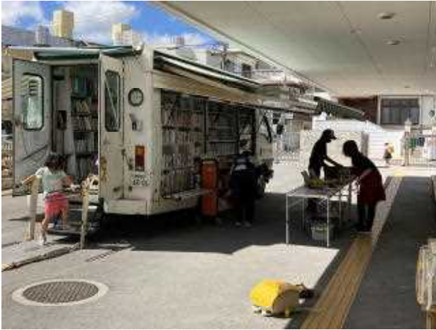
↑ちゅらゆめ号が来ました

☆今日の放課後は「ちゅらゆめ号」が志真志小に来てくれました。朝は読み聞かせ、帰りはちゅらゆめ号と、読書環境の充実した一日になりました。