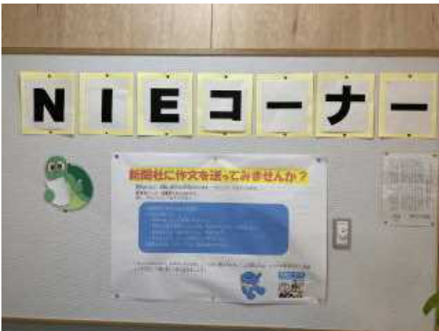
↑図書室前のNIEコーナー

☆今日の放課後は「ちゅらゆめ号」が志真志小に来てくれました。朝は読み聞かせ、帰りはちゅらゆめ号と、読書環境の充実した一日になりました。