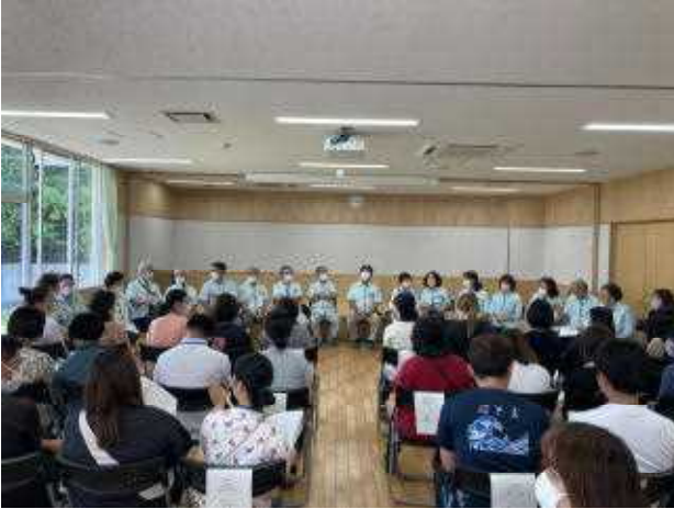
↑ 〈民生委員との情報交換会〉

5月2日に、本校校区担当の18名の民生委員の方に来校していただき、職員との情報交換会を行いました。その際、「本校児童は登校中によくあいさつしてくれる。あいさつが上手な子が多い。」とおほめの言葉をいただきました。