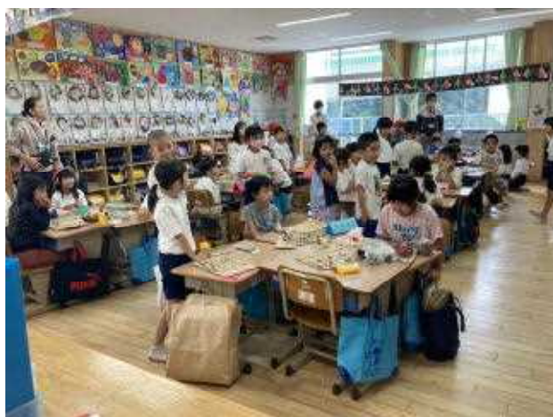
↑ ↓各グループで工夫しておもちゃづくり