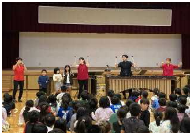
↑↓特別体験演奏もさせていただきました