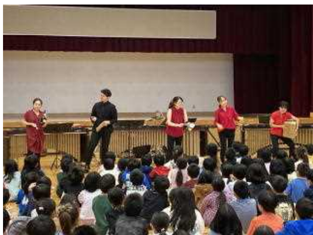
↑マリンバ以外の日用品も楽器に！