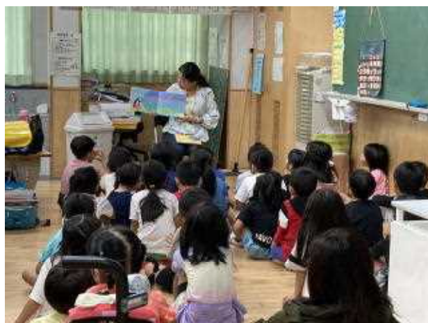
↑1年5組の読み聞かせの様子