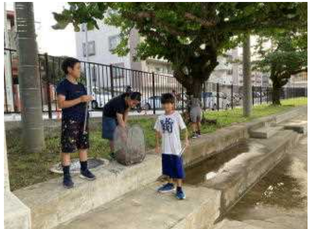
↑ 朝早く(7時20分頃)から、ボランティアで運動場周辺の葉っぱやゴミを拾ってくれていたステキな志真志っ子を発見しました! ボランティアありがとう!