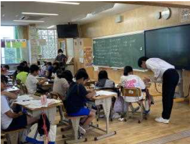
↑ ↓ 琉大生や学習支援員による支援