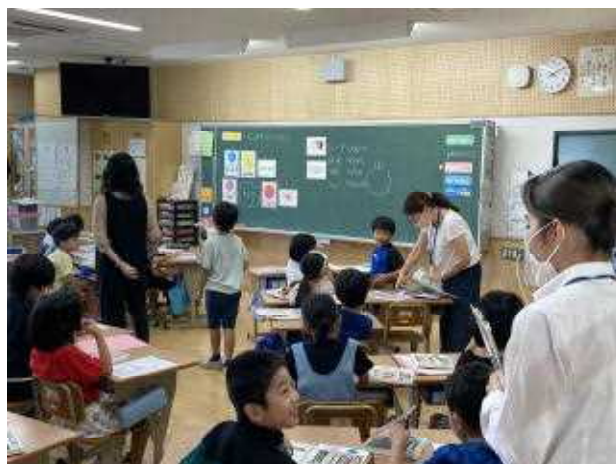
↑ALTによる英語の授業