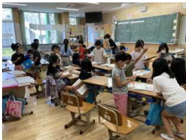
↑早く問題を解いた児童がリトルティーチャー

学校では、担任以外に、自分たちで教え合ったり、ALT（英語指導員）、特別支援指導員、算数学習支援員、琉大実習生、など多くの人に支援してもらって、学習の理解を深めようとしています。