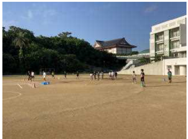
↑ 体育委員会の5・6年生は、毎朝、運動会練習のグランド準備をしてくれています。体育委員のおかげで助かっています。ありがとう!