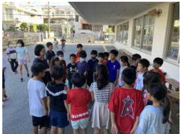
↑ 2年4組の朝のあいさつ運動振り返り ただやるだけじゃくて、振り返りも行っていて素晴らしい取り組み方です。