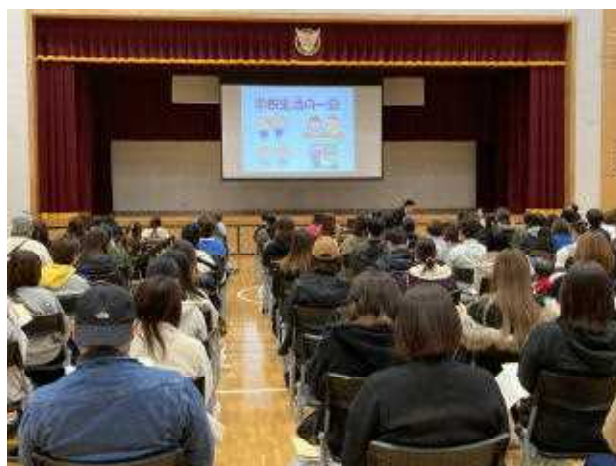
↑先週、無事に入学説明会を終えました。入学準備、よろしくお願いいたします。お子様の入学、おまちしております。