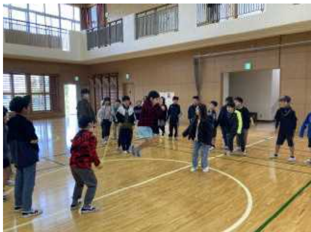
↑昨日の昼休みは3年生の長縄大会を行いました。体育委員の6年生が一生懸命準備してくれました。結果は以下の通りです。