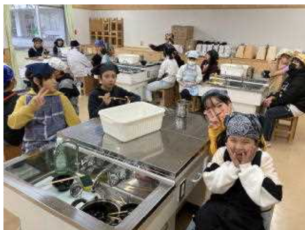
↑家庭科室前を通ると何やらいい香りが・・・5年生が調理実習中。味噌汁を作っていました。煮干しの優しい、いい出汁がでて、味噌の量もちょうどよくて、美味しくできてました！