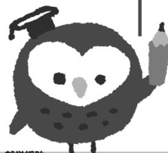
就学援助 イメージキャラクター ツクロウくん

学校教育法などにもとづいて、小中学校の子どもがいる家庭に学用品費や学校給食費などを市町村が援助する制度です。子どもたちの安心して楽しい学校生活のために、気軽に就学援助制度を活用してみませんか。