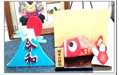
事務室前のディスプレイ

令和元年が素晴らしい1年になるよう、地域・保護者のみなさんの変わらぬご支援・ご協力をよろしくお願いいたします。