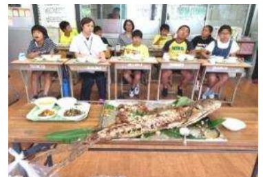
みんなおいしそうですね