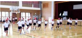
5年生シャトルランの様子