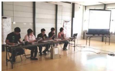
↑担任の先生による読みかせ(4年)

本校では、平和教育に関する読み聞かせや、平和写真展などに取り組んでいます。6/23は慰霊の日でした。ご家庭でも平和について考える時間を設けてみてはいかがでしょうか。