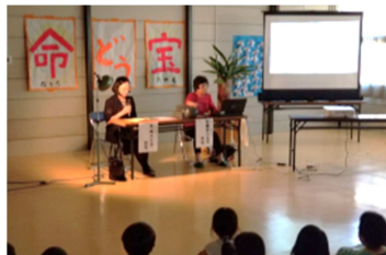
↑退職校長先生方による読み聞かせ