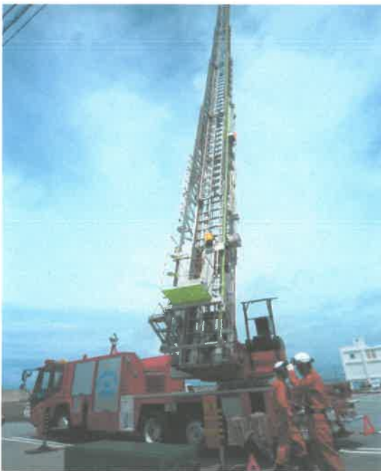
はしご車搭乗体験