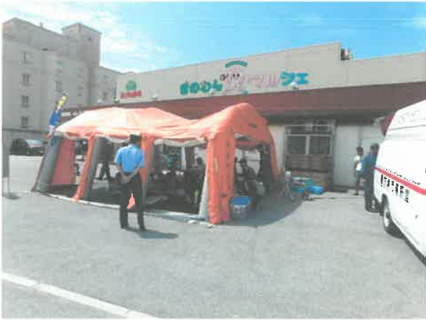
エアーテント設定