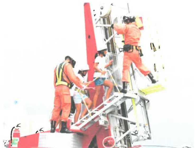
はしご車搭乗体験