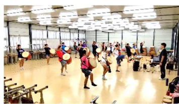
7/26 夏休みエイサー練習 (6年)