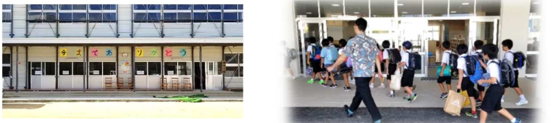
8/26 ↑プレハブ校舎から いよいよ新校舎へ！ ↑