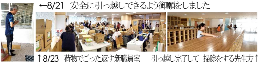
←8/21 安全に引っ越しできるようお願いをしました ↑8/23 荷物でごった返す新職員室 引っ越し完了して 掃除をする先生方↑