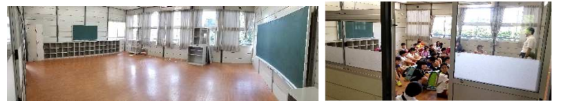
8/26 始業式の日 プレハブ校舎に登校して、机・いすの無い教室で新校舎への移動方法の説明を聞き…